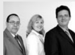
Mit den besten Grüßen

In diesem Sinne hoffen wir, dass Sie in diesem Newsletter einige für Sie inspirierende Inhalte entdecken.